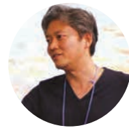
伊東 将志 氏

三重県上野市 (現:伊賀市) 出身・在住。早稲田大学教育学部卒業。1974年アナウンサーとして関西テレビへ入社。2012年9月までアナウンサーとしての活動と並行しながら神戸女子大学及び帝塚山大学の非常勤講師を務めた。2012年11月伊賀市長就任。