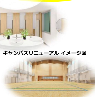
キャンパスリニューアル イメージ図

体育館,国際文化ホール, 研究棟・トイレ,空調,Wi-Fiなど リニューアルします!!